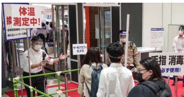
③ 全入場者へ 体温測定を実施