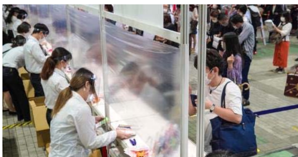
⑤ 受付に 飛沫防止シートを設置