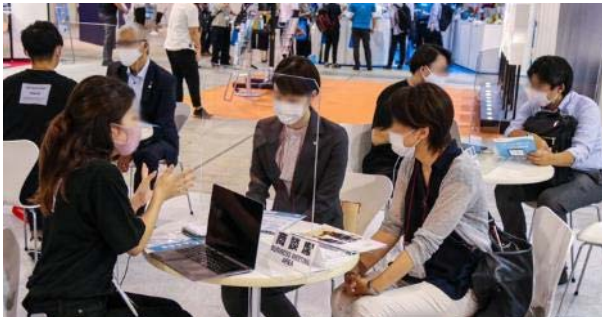
① 全参加者へ マスク着用を徹底